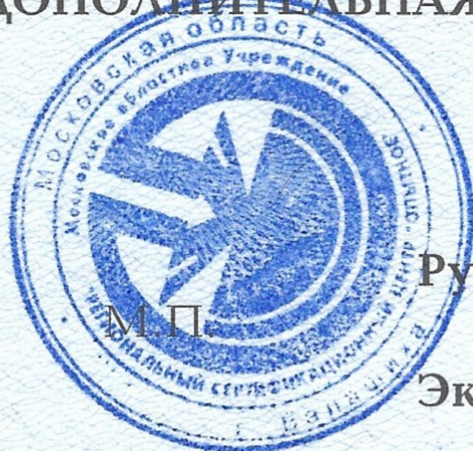
Схема сертификации №1с